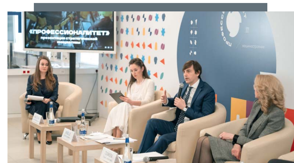
Запуск проекта «Профессионалитет».

— В Год педагога и наставника я хотел бы, чтобы каждый вспомнил своего учителя, может быть, это будет учитель начальных классов или средней школы, который оказал сильное влияние на вашу судьбу, карьерный путь, выбор профессии. Навестите его или позвоните. Успех ученика — это в том числе успех учителя. HR